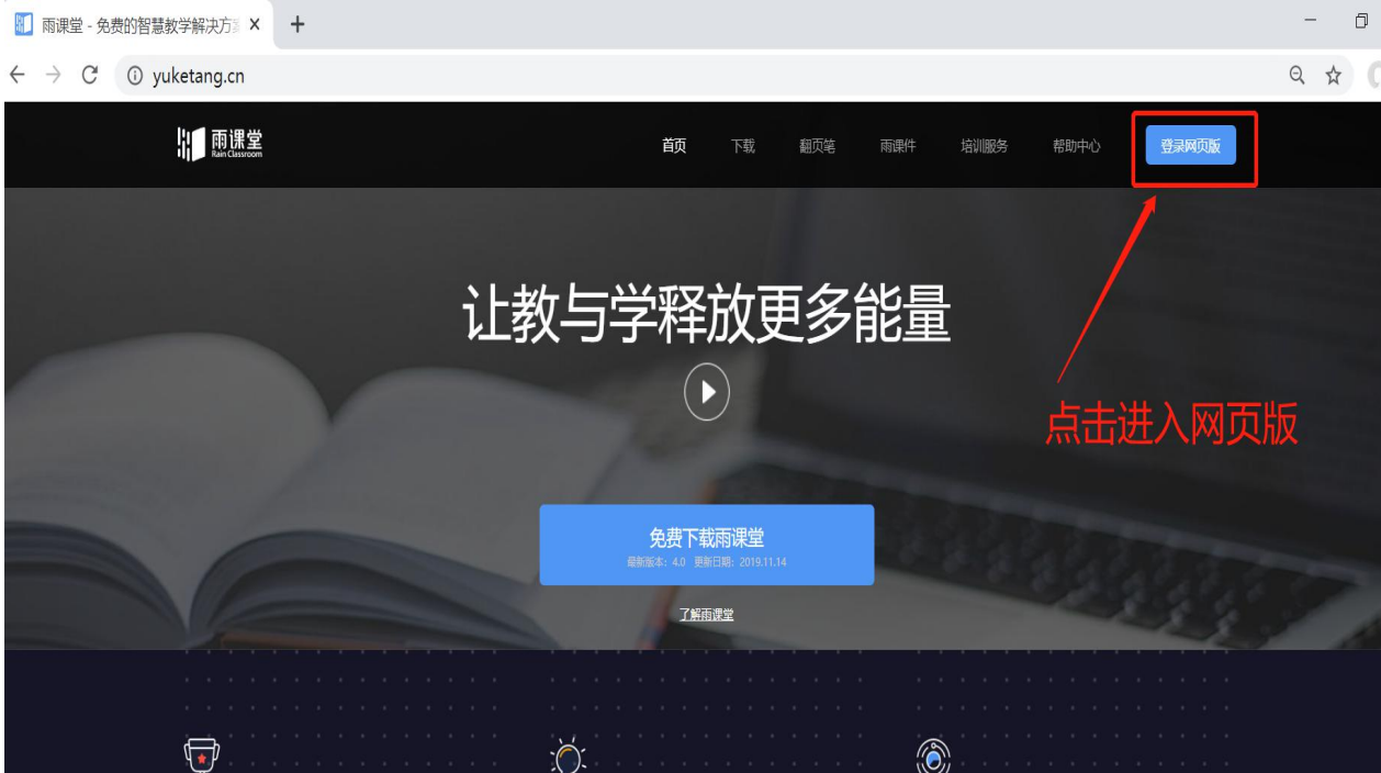
图 7 雨课堂网页版登录界面

进入课程观看页面后，按照图 8 的箭头指示点击进入当前直播页面，选择【进入大屏显示】，如图 9 所示，即可进入大屏直播页面。