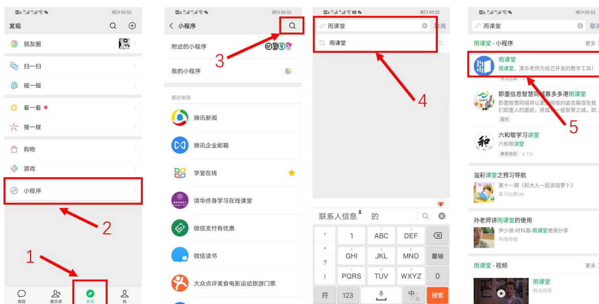
图4 搜索进入雨课堂小程序

进入雨课堂小程序后，在小程序上方若发现有“你有1个课正在上课”的提示，点击该提示即可进入直播。如图5所示。