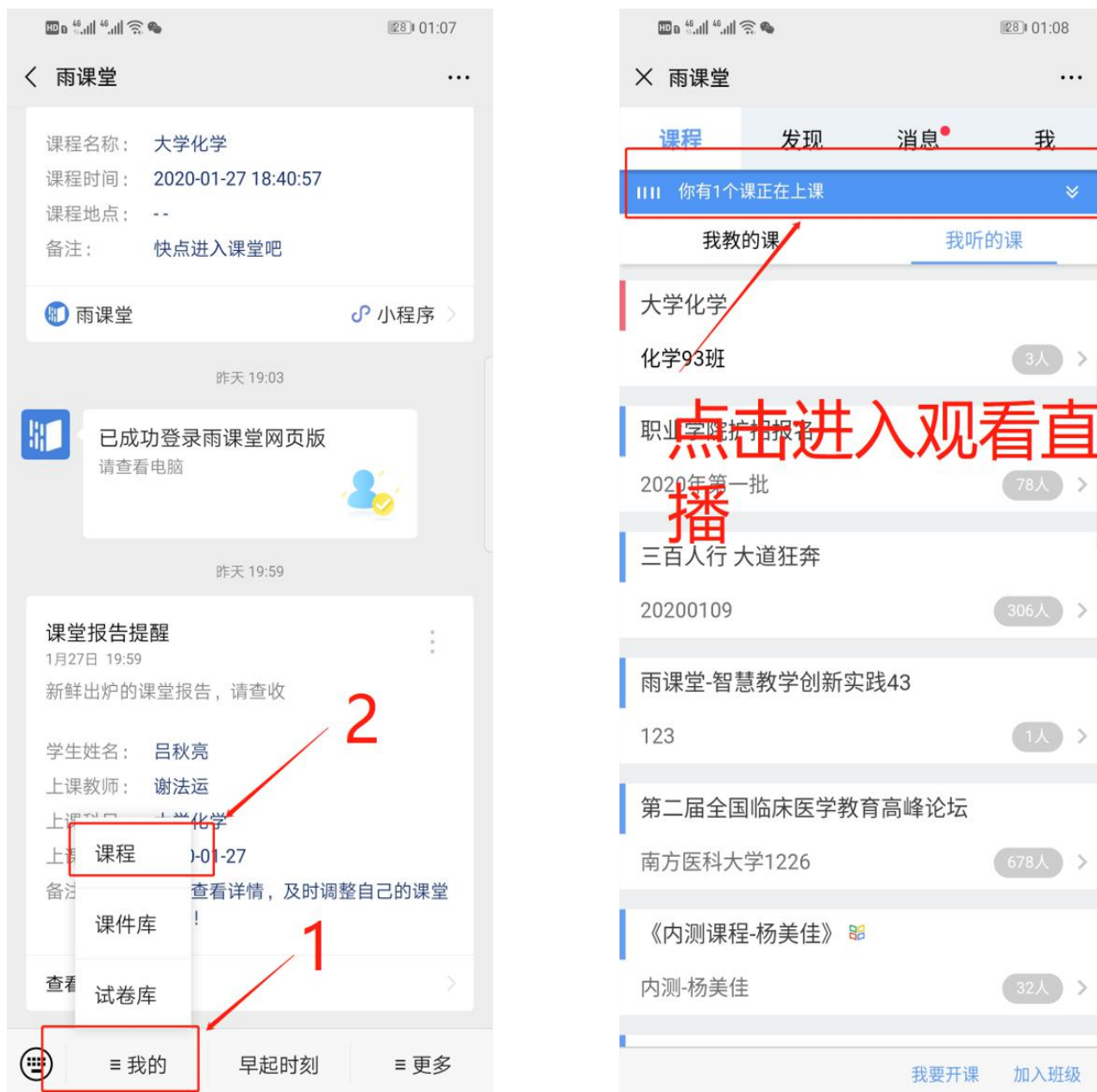
图 6 公众号进入直播

从雨课堂公众号菜单里【我的】-【课程】进入雨课堂功能界面，若看到页面上方有“你有 1 个课正在上课”的提示，点击该提示即可进入直播。如图 6 所示。