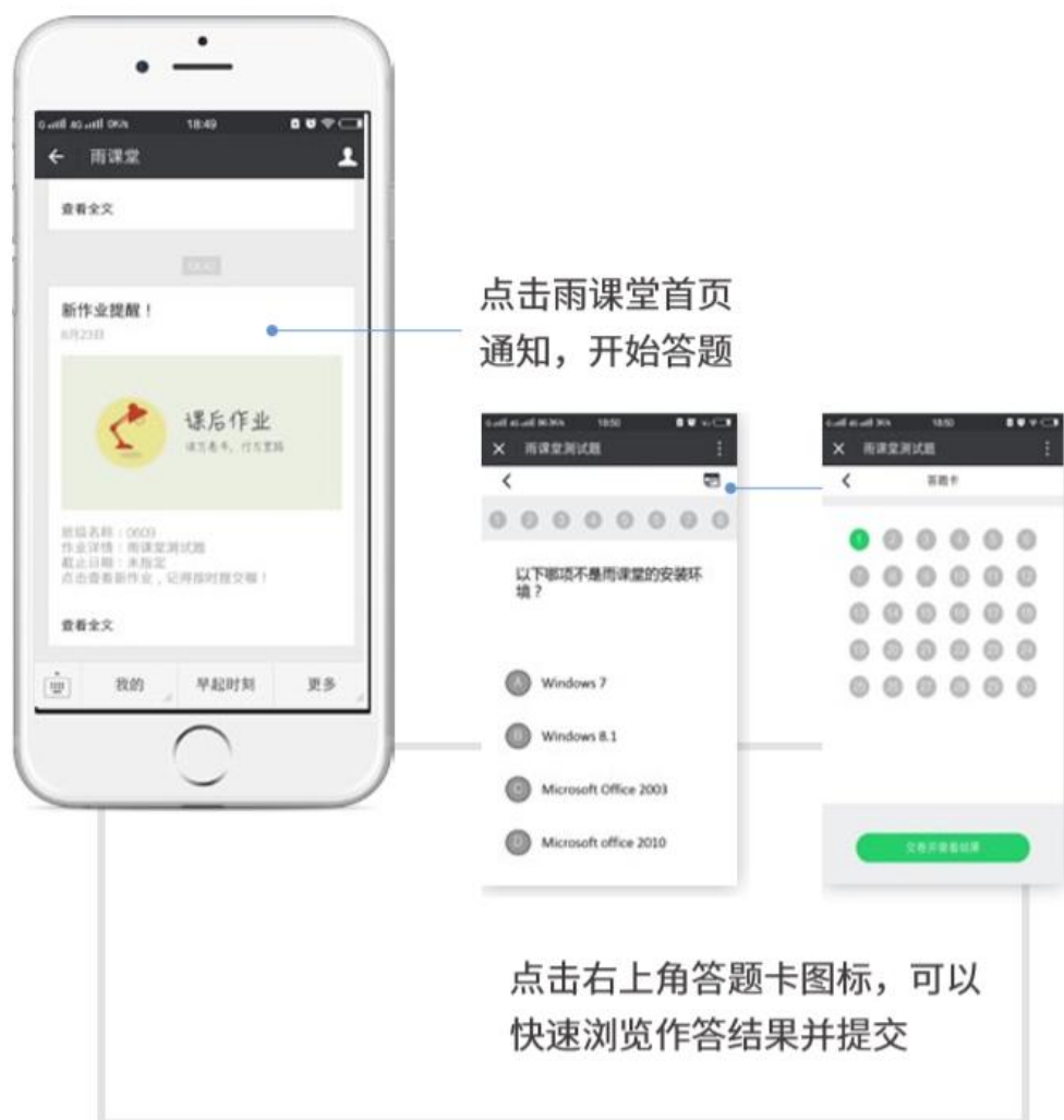
图 16 作业提醒