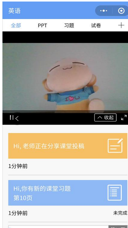
图 9 学生手机端直播预览效果

学生端手机端视频直播效果预览如图 10 所示,无论使用语音直播或视频直播,远程授课可同时进行随堂测试、弹幕、投稿等课堂活动。