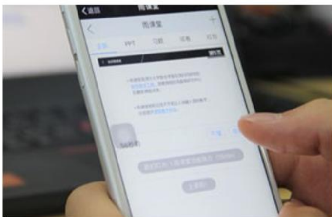
图 11 学生匿名反馈操作

每页 PPT 下的【收藏】按钮帮助各位同学及时收藏下老师敲黑板的重点 PPT，方便课后复习查看，如图 11 所示。（温馨提示：听课过程中，哪里不懂点哪里，以便下次课老师把多数同学不懂的知识点重新讲解，千万别羞涩，匿名的！）