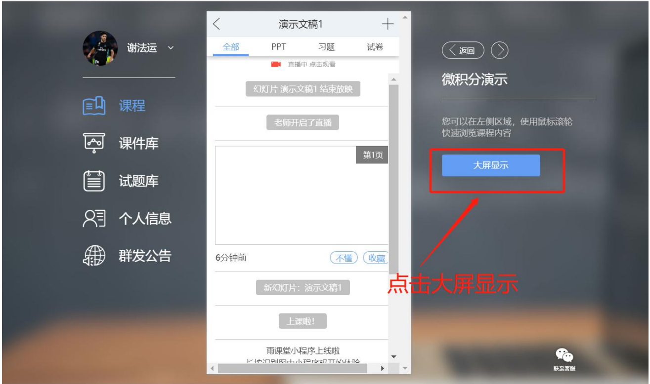
图 9 可进入大屏显示