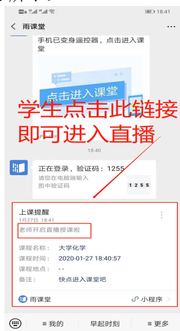
图3 学生接收上课直播提醒

（1）教师可在开启直播时给学生发送通知，学生可在微信公众号里收到直播提醒，点击此消息即可进入直播。如图3所示。