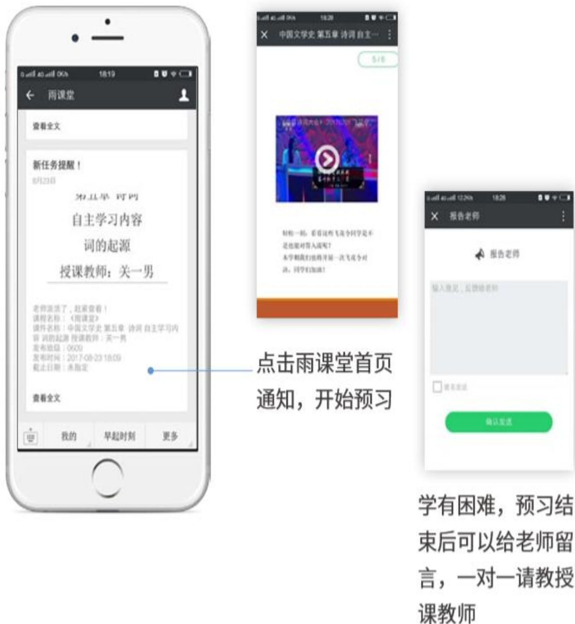
图 15 接收预习任务并完成预习