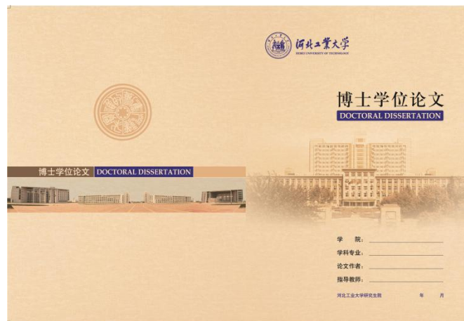
图 2.1 博士学位论文封面样式