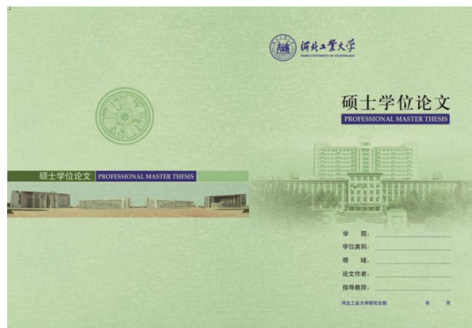
图 2.3 专业学位硕士学位论文封面样式