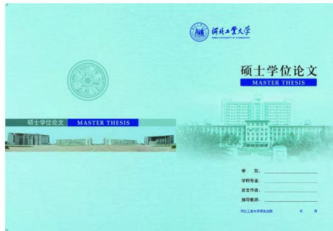
图 2.2 学术学位硕士学位论文封面样式