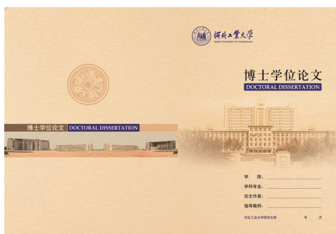
图 2.1 博士学位论文封面样式