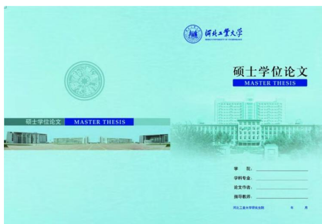
图 2.2 学术学位硕士学位论文封面样式