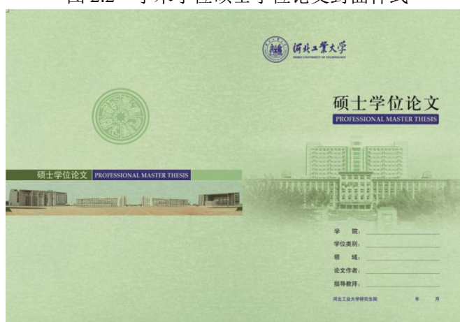
图 2.3 专业学位硕士学位论文封面样式